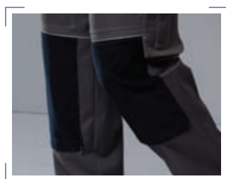
Robuste Cordeinsätze sorgen für Stabilität und Langlebigkeit.